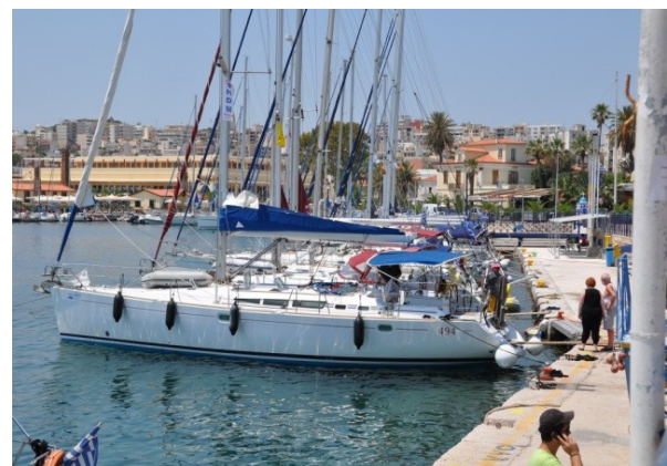
Seilskipet som vi leide.